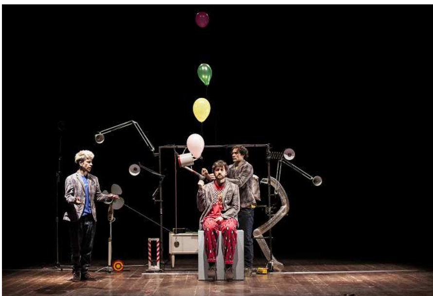
Fa la cosa Faticosa