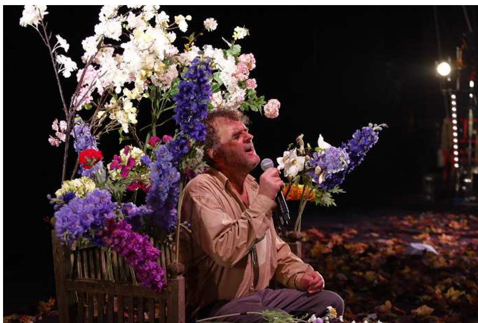
La Gioia

Nel 2021 sono previsti in cartellone al Comunale di Bolzano: Il grigio , di Giorgio Gaber e Sandro Luporini per la regia di Giorgio Gallione, con Elio, La notte dell'innominato con Eros Pagni dello Stabile di Brescia, La mia vita raccontata male In bilico con Claudio Bisio dal romanzo di Francesco Piccolo con regia di Giorgio Gallione (del TS Genova); La gioia di Pippo del Bono di Emilia Romagna Teatro.