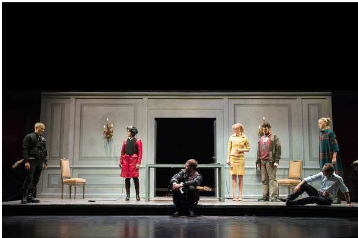
Peachum, Un'opera da tre soldi

Il capitolo di spese per allestimento comprende un budget di spese per il personale artistico e tecnico che lavora alla realizzazione dell'opera, nonché i costi per i materiali scenotecnici di costruzione delle scene, dei costumi e delle attrezzature. Ogni spettacolo prodotto ha un budget di allestimento che viene assegnato alla produzione nei limiti economici e finanziari del capitolo di spesa. All'interno del capitolo pertanto troviamo retribuzioni lorde di specialisti, regista, scenografo, costumista, ecc. e spese di beni e servizi, inoltre sono considerati anche gli oneri sociali e fiscali a carico del teatro.