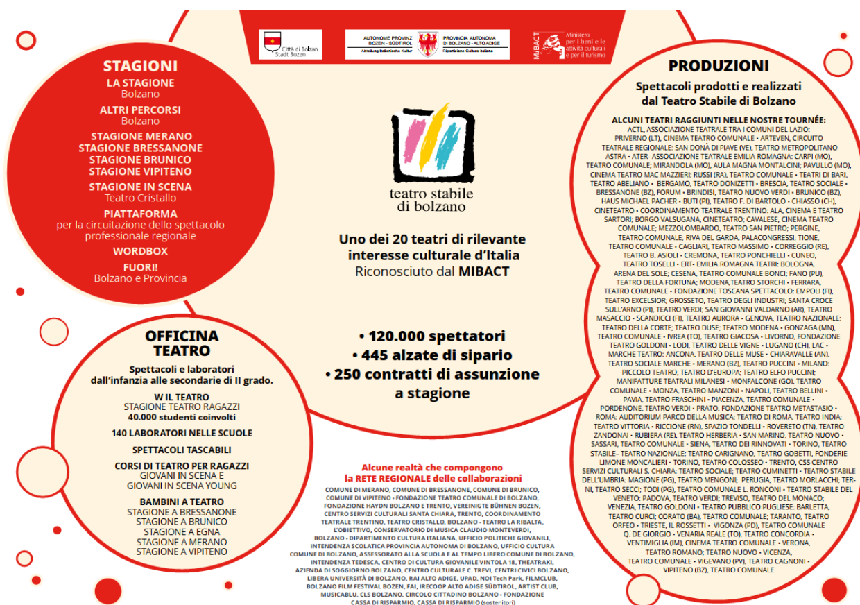
Nello schema si fa riferimento alla situazione preCovid.

Per l'anno 2021 quindi l'attività del Teatro Stabile di Bolzano è più che mai composita, variegata, stratificata e diretta ad un pubblico che sia il più ampio possibile, tenendo sempre presente la natura di territorio di confine in cui il Teatro opera, per cui svolge una funzione fondamentale di riferimento per una comunità ancora giovane, e di ponte linguistico, culturale e identitario per tutti gli abitanti del territorio.